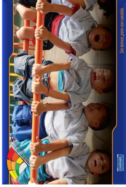
Sin temor, pero con cautela.